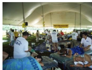
ホノルルマラソン

活動拠点を国内にとどまらず 海外へも積極的に医療ボラン ティア活動を実施しています。