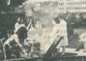
阪神・淡路大震災