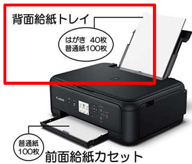
○ 背面のA4給紙枚数が充分ある

□ 連続給紙できるかチェックするには、背面トレイのA4（普通紙）給紙枚数を確認してください。