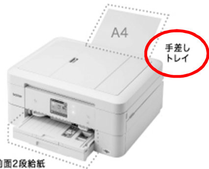
× 背面トレイが「手差し」しかない