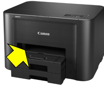
× 背面から給紙できないプリンター

□ 連続給紙できるかチェックするには、背面トレイのA4（普通紙）給紙枚数を確認してください。